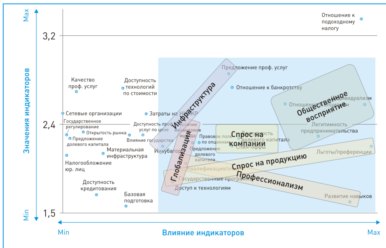
Рис. 2. Индикаторы и направления развития инновационно-венчурной экосистемы

В соответствии с выявленными шестью основными областями развития экосистемы технологического предпринимательства определены шесть из семи программ ОАО «РВК» на 2011-2013 годы.