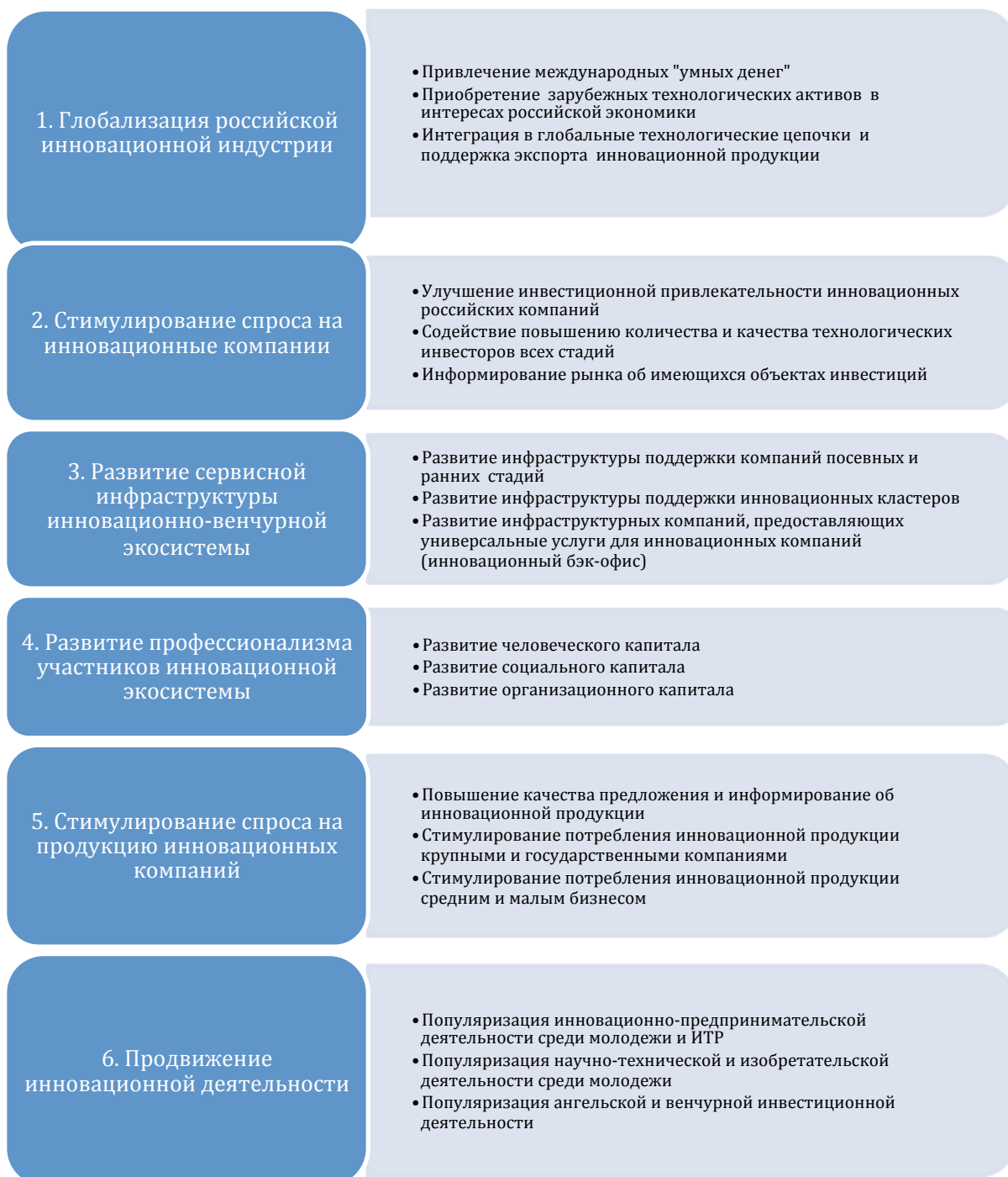
Рис. 3. Программы и инициативы ОАО «РВК» по развитию инновационно-венчурной экосистемы на 2011-2013 годы.

направления целевой деятельности в рамках каждой программы. Разбиение «экосистемных» программ на отдельные инициативы приводится на Рис. 3.